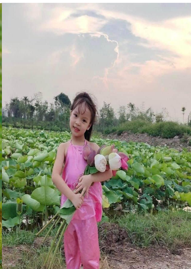
Nhiều du khách sẵn sàng đầu tư hàng trăm nghìn đồng để mua một bó sen làm phụ kiện chụp ảnh