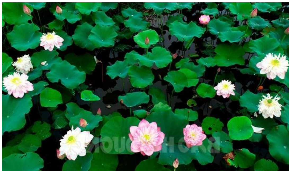
Sen tại cánh đồng này chủ yếu được nhập khẩu từ nước ngoài nên màu sắc và chủng loại rất đa dạng và bắt mắt