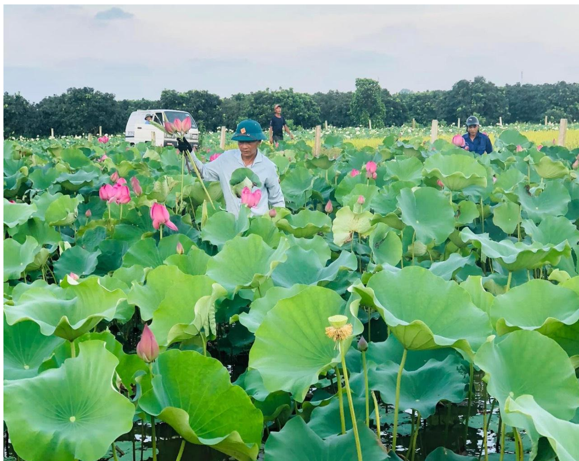
Mỗi ngày cánh đồng sen cung cấp cho thị trường từ 1.000 – 3.000 bông sen