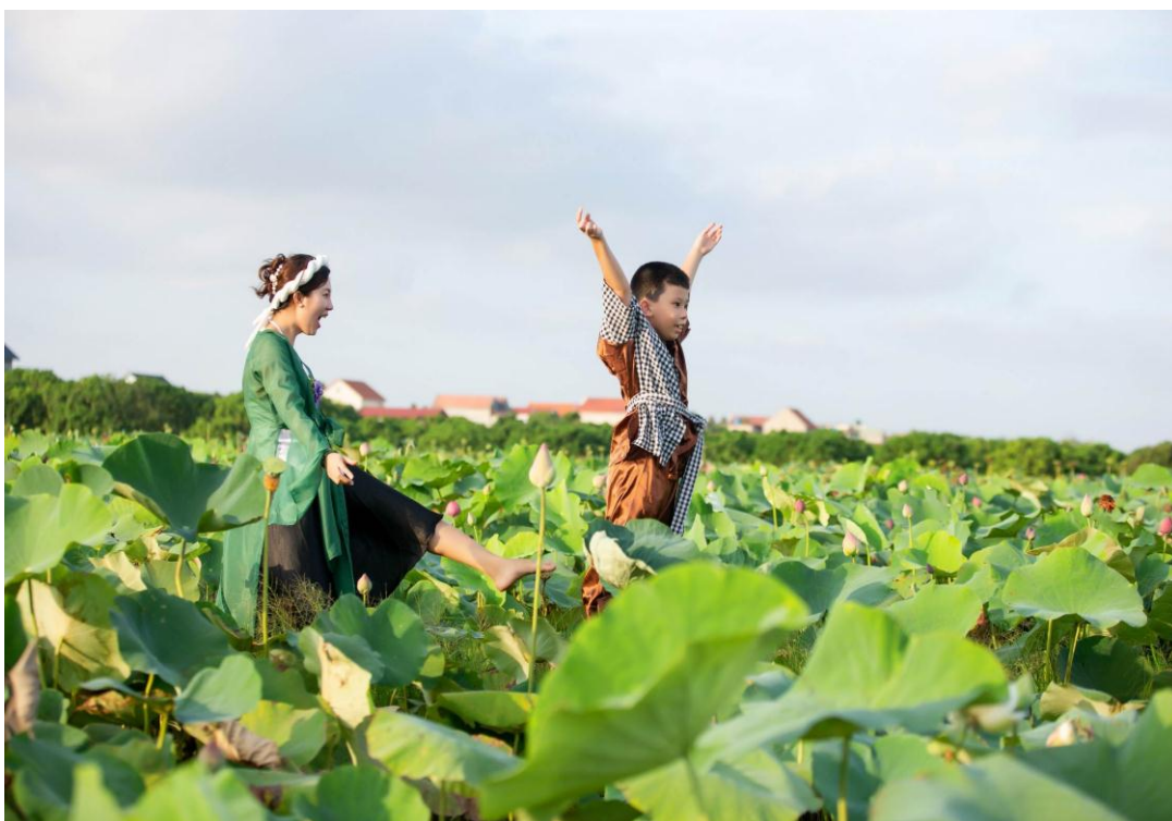
Cánh đồng sen rộng mênh mông này còn là nơi vui đùa của đám trẻ trong làng mỗi khi chiều về