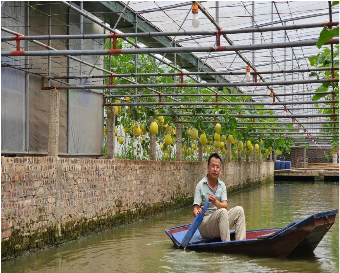
Từ mùa thu đến mùa xuân là khoảng thời gian du khách đến trang trại đông nhất vì thời tiết mát mẻ