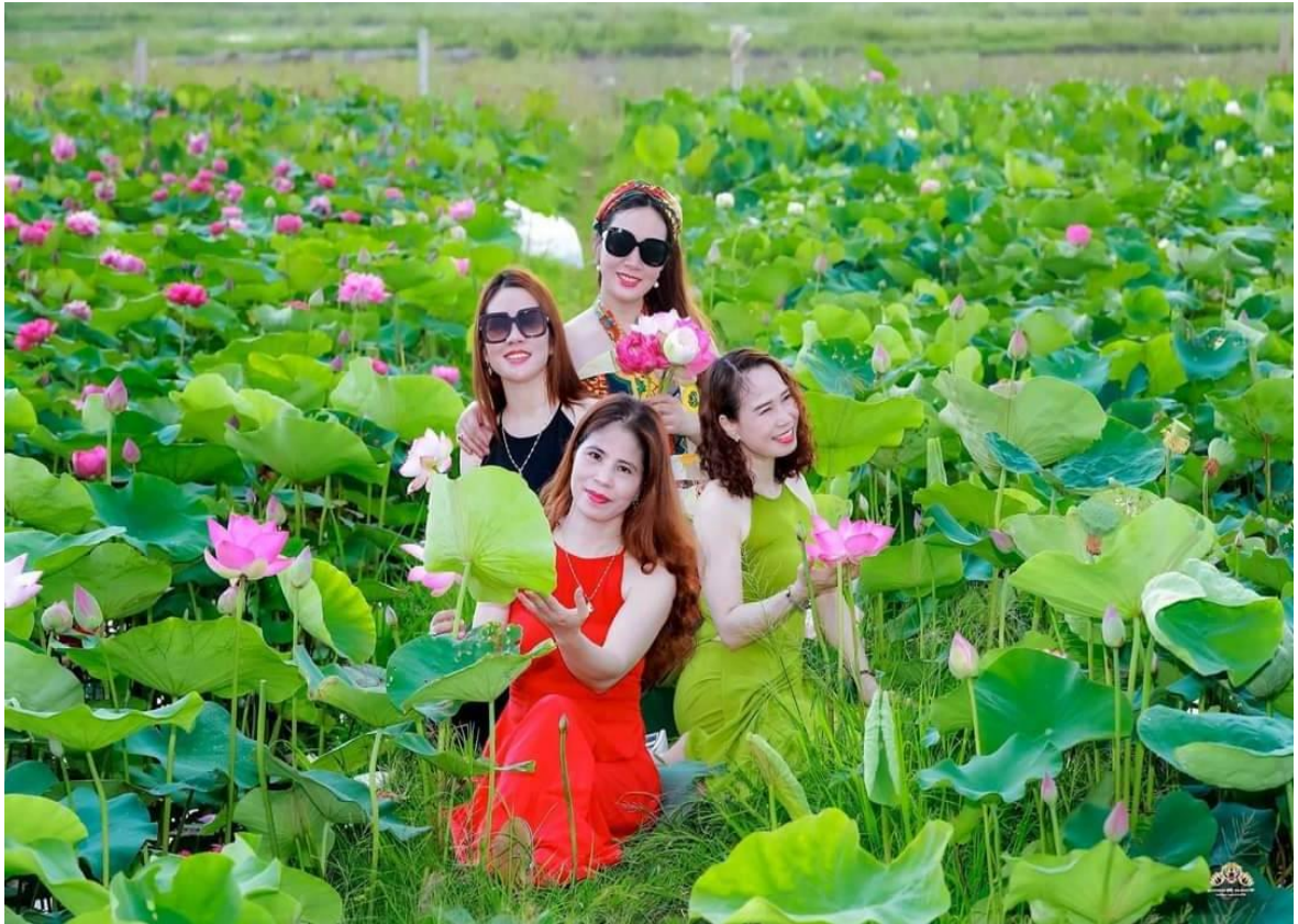
Mỗi ngày thu hút từ vài chục đến vài trăm lượt khách đến tham quan, chụp ảnh.