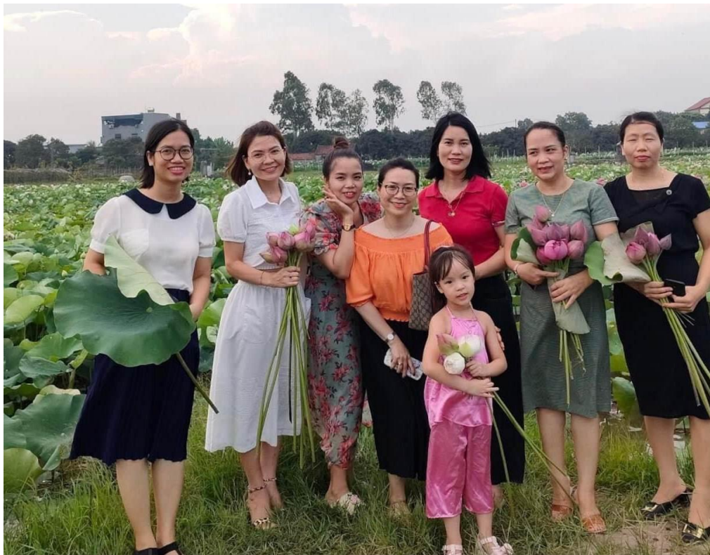
Gia đình anh Soay không thu bất cứ một loại phí nào của du khách mà chỉ bán hoa sen cho ai có nhu cầu